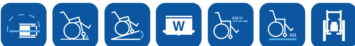
Diamètre de giration ▼