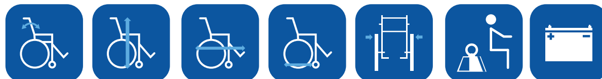
Inclinaison du dossier ▼

480 / 540 mm Flex 3 : 506 / 610 mm Matrix : 400 / 500 mm